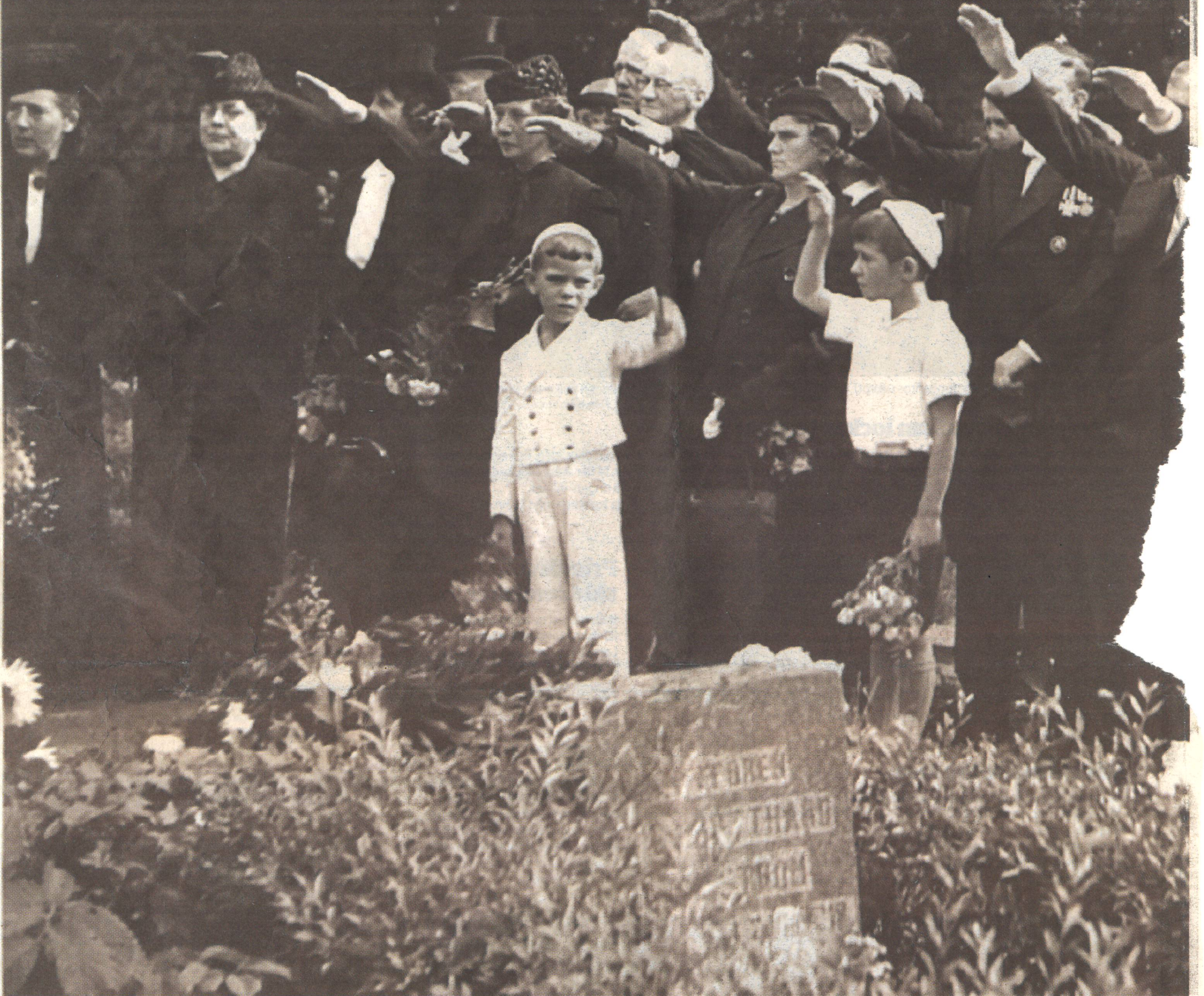
Kontroversiell bild. Stig Hartmans foto från begravningen av den tyske flygaren på Västra kyrkogården den 11 juli 1943 har väckt uppmärksamhet. En av dem som har reagerat är Dieter Friedrich som